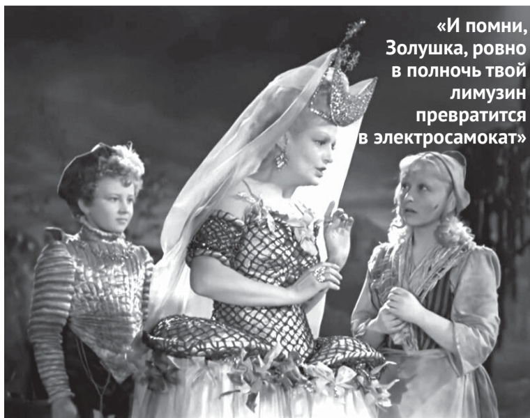
«И помни, Золушка, ровно в полночь твой лимузин превратится в электросамокат»