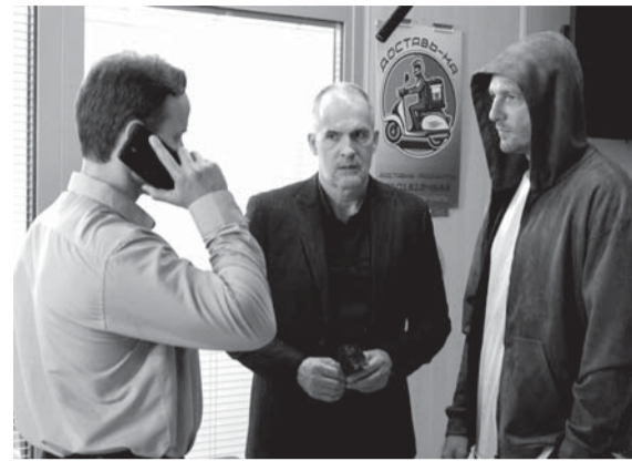
А следом продолжение «В тени больших чисел-2. Улики из будущего». (16+)