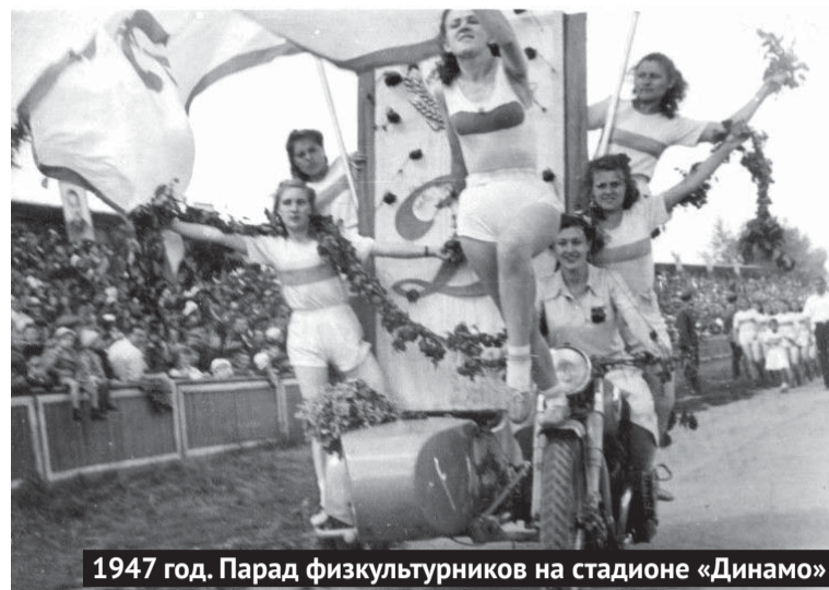
1947 год. Парад физкультурников на стадионе «Динамо»