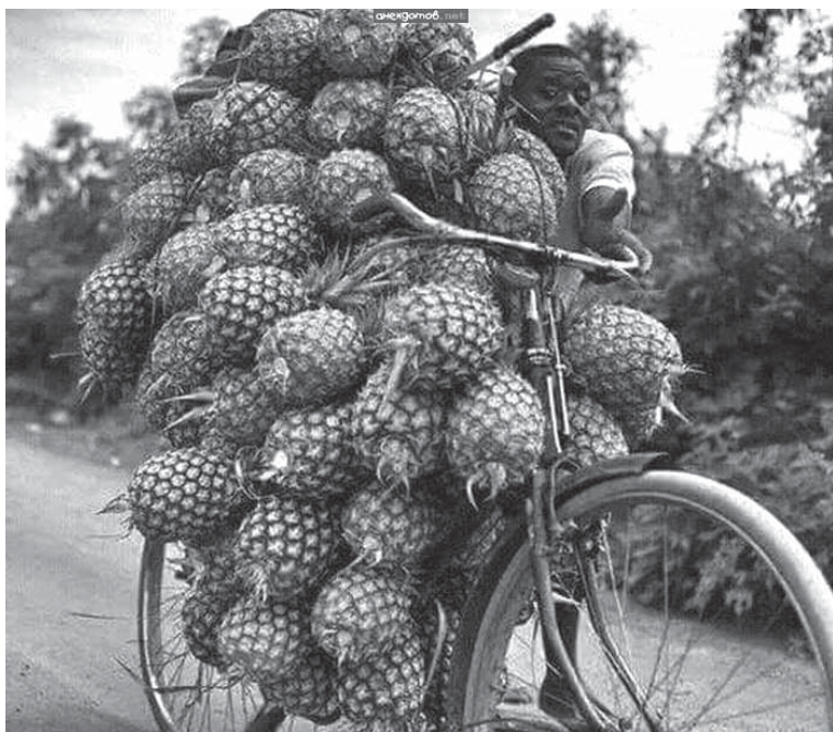
Вот это урожай! А вы всё картошка, картошка...