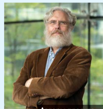
Авторы проекта — доктор Джордж Черч и бизнесмен Бен Лэмм

Интересно, что в этом исследовании не остались в