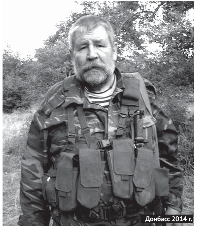
Донбасс 2014 г.