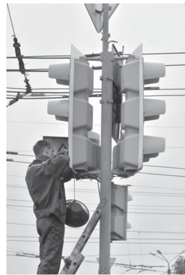
Страницу подготовила Ольга БОРОВАЯ.

светофоров можно улучшить ситуацию и при этом минимизировать затраты на установку дорогостоящих систем.