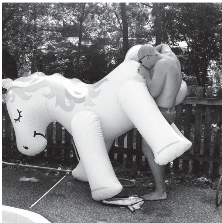
В другом месте дырочку для надувания лошадки сделать было нельзя...

■ ■ ■ Закатом небо догорает, А современный дед Мазай на «Мерседесе» подбирает Двух зай.